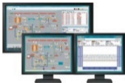
監視用パッケージソフトCISAS